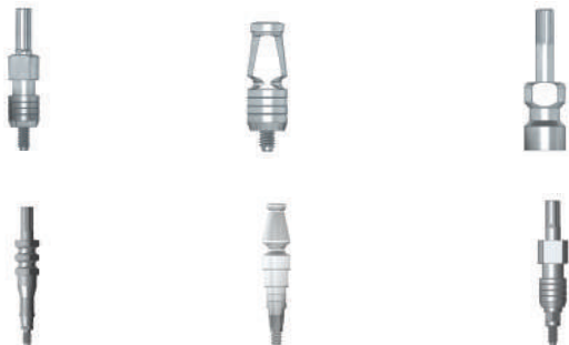
TABELA DE CÓDIGO DAS FAMÍLIAS DO PRODUTO

A família deste produto pode ser identificada através dos dois primeiros dígitos do código do produto que serão: