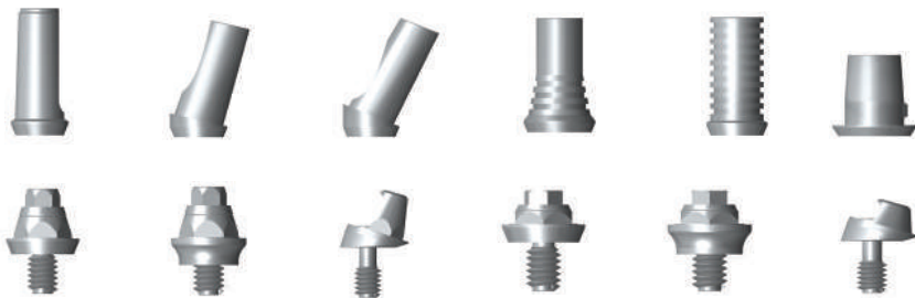
TABELA DE CÓDIGO DAS FAMÍLIAS DO PRODUTO

A família deste produto pode ser identificada através dos dois primeiros dígitos do código do produto que serão: